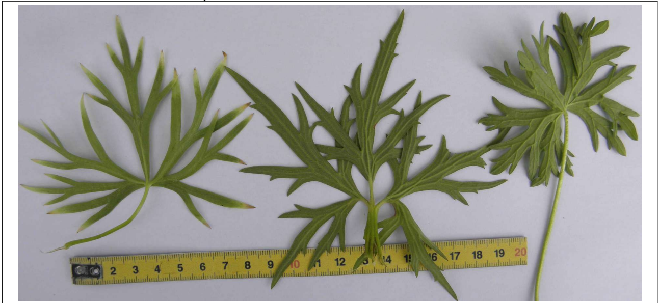
Aconitum cf. napellus très dangereux !

il y a aussi des ressemblances entre certaines feuilles de Geranium dissectum et Aconitum napellus :