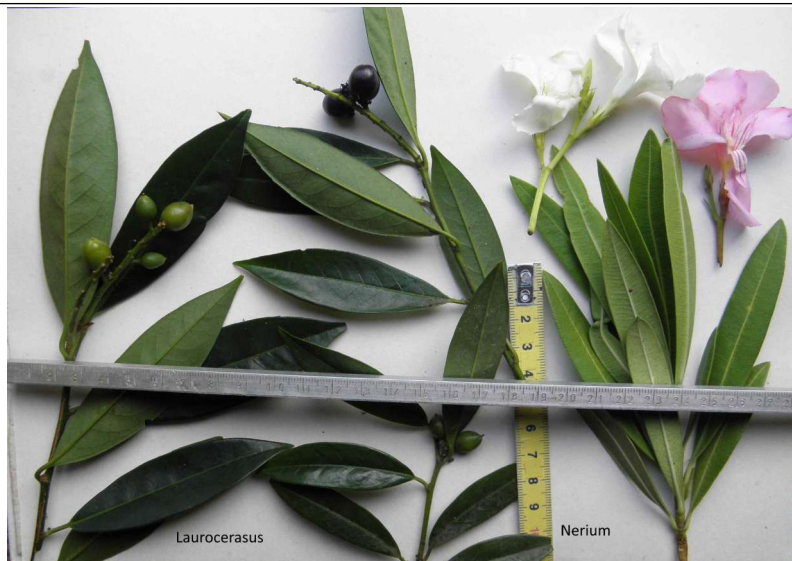
3 Prunus laurocerasus à limbes étroits ; règle jaune ; Nerium oleander (1 rose, 1 blanc) (en bas près de la règle : limbes les plus petits, entiers) "laurier rose ou blanc" très toxique

Malaspina et al. (2022-Misidentification between laurel... Toxins) comparent les feuilles de ces 2 sp mais probablement 1 seul échantillon de Prunus l. , la variabilité (selon individus ou cv.) n'est pas prise en compte. Ainsi, les caractères acuminés (ne sont pas exclusifs de Laurus nobilis mais existent aussi chez des P. laurocerasus à limbes étroits) ou denté (ce n'est que pour certains individus de Pr.l. ) ou localisation de la plus grande largeur des limbes (dans la moitié sup. n'est valable que pour certains individus de P. laurocer. ) ne sont pas totalement différentiels ; la nervation tertiaire n'est pas visible chez tous les Pr.l. et se voit mieux à sec chez Laurus n. y compris jusqu'à un réseau de c.1/3mm.