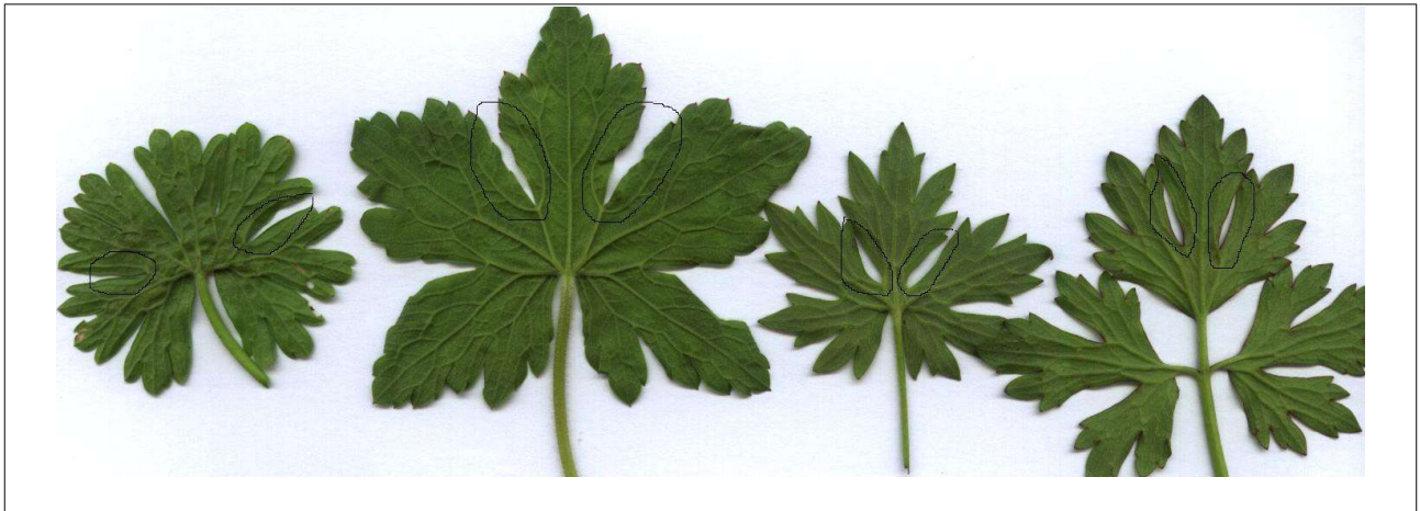
Ex. Geranium dissectum ; Geranium oxonianum ; Ranunculus acris ; Ranunculus repens

il y a aussi des ressemblances entre certaines feuilles de Geranium dissectum et Aconitum napellus :