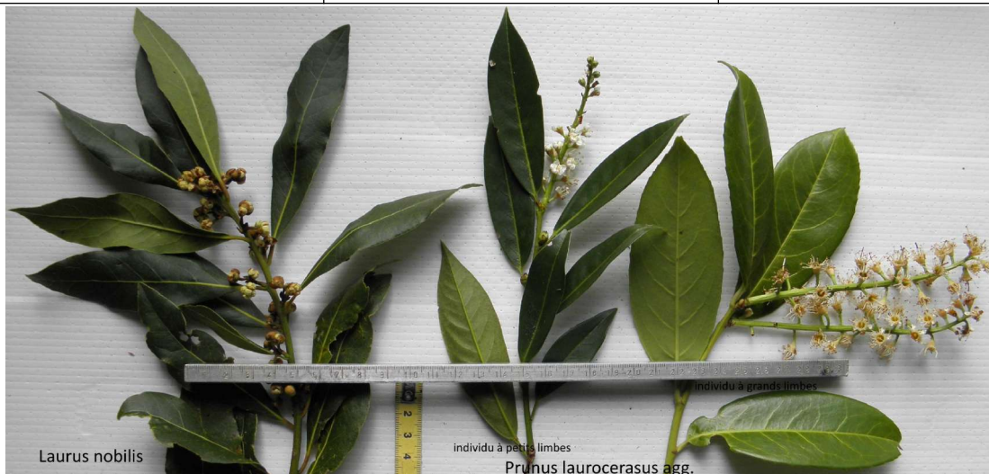
1 pousse de Laurus nobilis ; échelle jaune ; 2 pousses de Prunus laurocerasus agg.

Malaspina et al. (2022-Misidentification between laurel... Toxins) comparent les feuilles de ces 2 sp mais probablement 1 seul échantillon de Prunus l. , la variabilité (selon individus ou cv.) n'est pas prise en compte. Ainsi, les caractères acuminés (ne sont pas exclusifs de Laurus nobilis mais existent aussi chez des P. laurocerasus à limbes étroits) ou denté (ce n'est que pour certains individus de Pr.l. ) ou localisation de la plus grande largeur des limbes (dans la moitié sup. n'est valable que pour certains individus de P. laurocer. ) ne sont pas totalement différentiels ; la nervation tertiaire n'est pas visible chez tous les Pr.l. et se voit mieux à sec chez Laurus n. y compris jusqu'à un réseau de c.1/3mm.