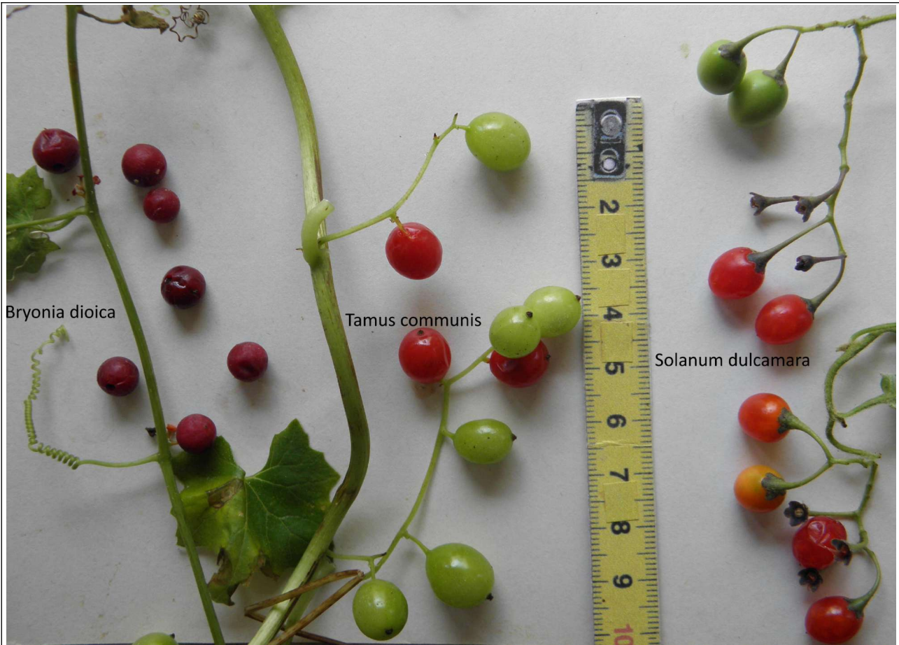
3 lianes herbacées (ou presque pour Solanum dulcamara ) à fruits toxiques rouges à maturité c1cm