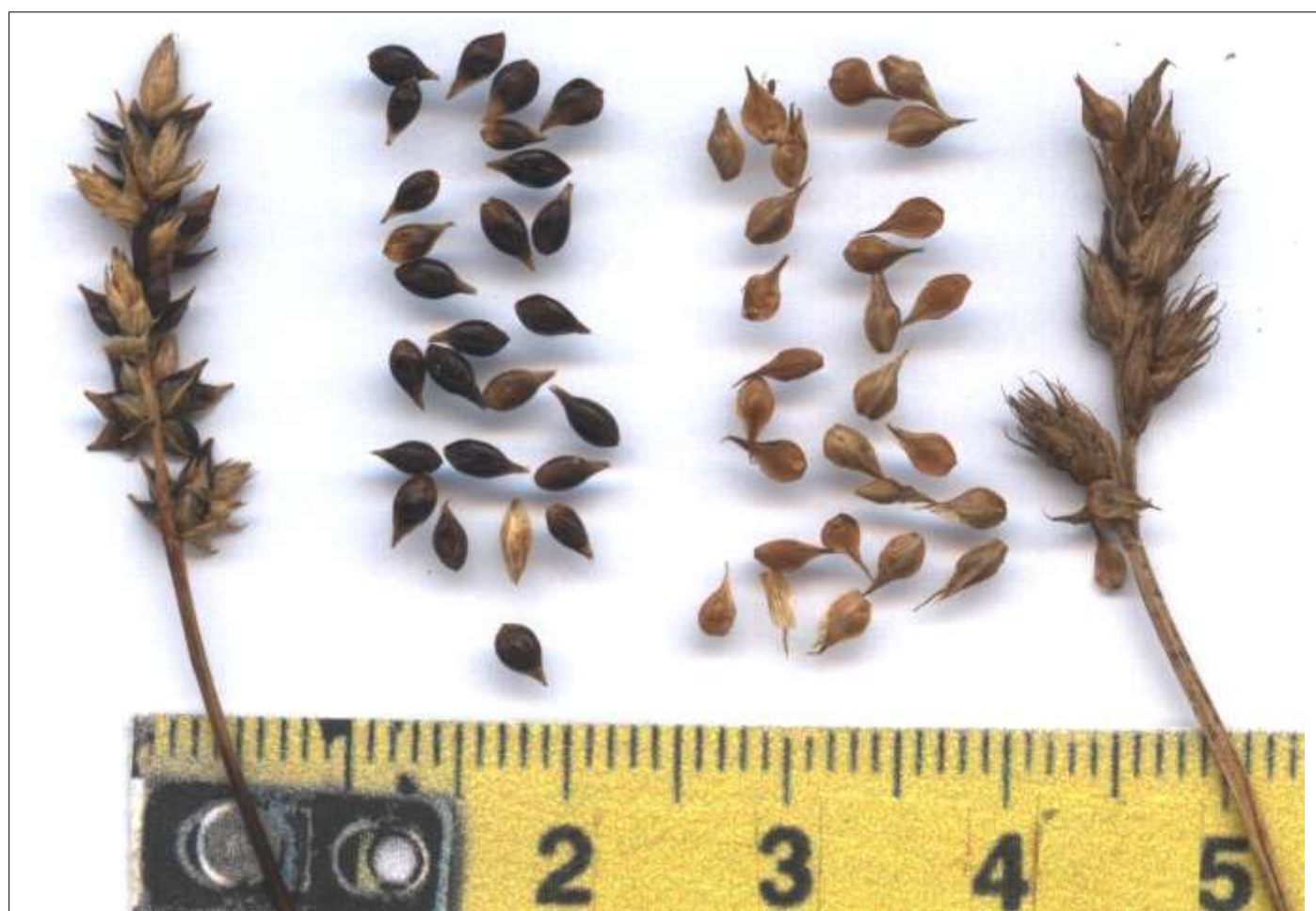
gauche : subsp. muricata (serpentines de Pouldreuzic, 1995)

NB : C. pairaei est synonyme des 2 subsp. selon les auteurs (cf. FE). in Jermy & Tutin (Sedges...) d'autres critères ou états sont donnés ; les dessins des utricules sont problématiques (voir photos in Sta4)