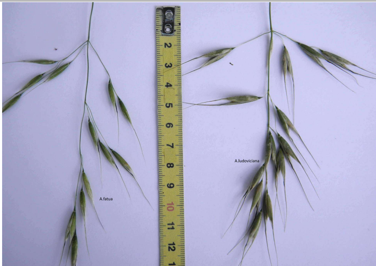
base d'épillets: A. fatua plutôt étroit-cônique; échelle; A. ludoviciana plutôt large-arrondi