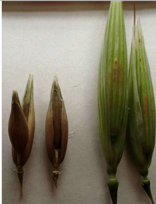
Avena sativa : cultivar foncé après anthèse ; Avena nuda : cultivar clair avant anthèse