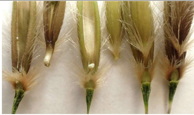
Avena ludoviciana . Détail dont les 2 premiers épillets à rachéole coupée entre F1 et F2 ; les 2 à droite entiers.