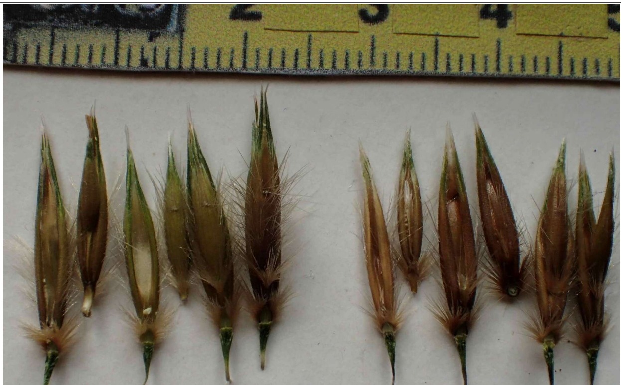
Avena ludoviciana (légende + détails en tab. en dessous) ; Avena fatua (1er épillet : rachéole entre F1 et F2 cassée ; au milieu : fleuron tombé)