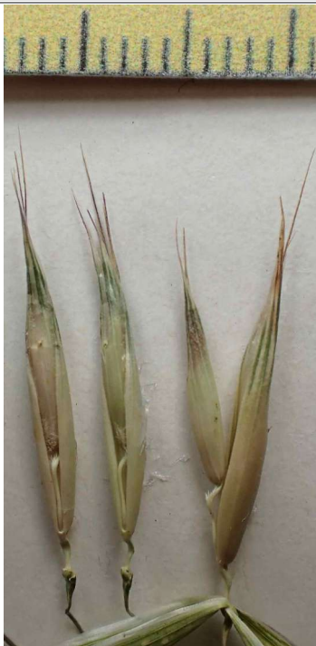
Avena strigosa : 3 épillets