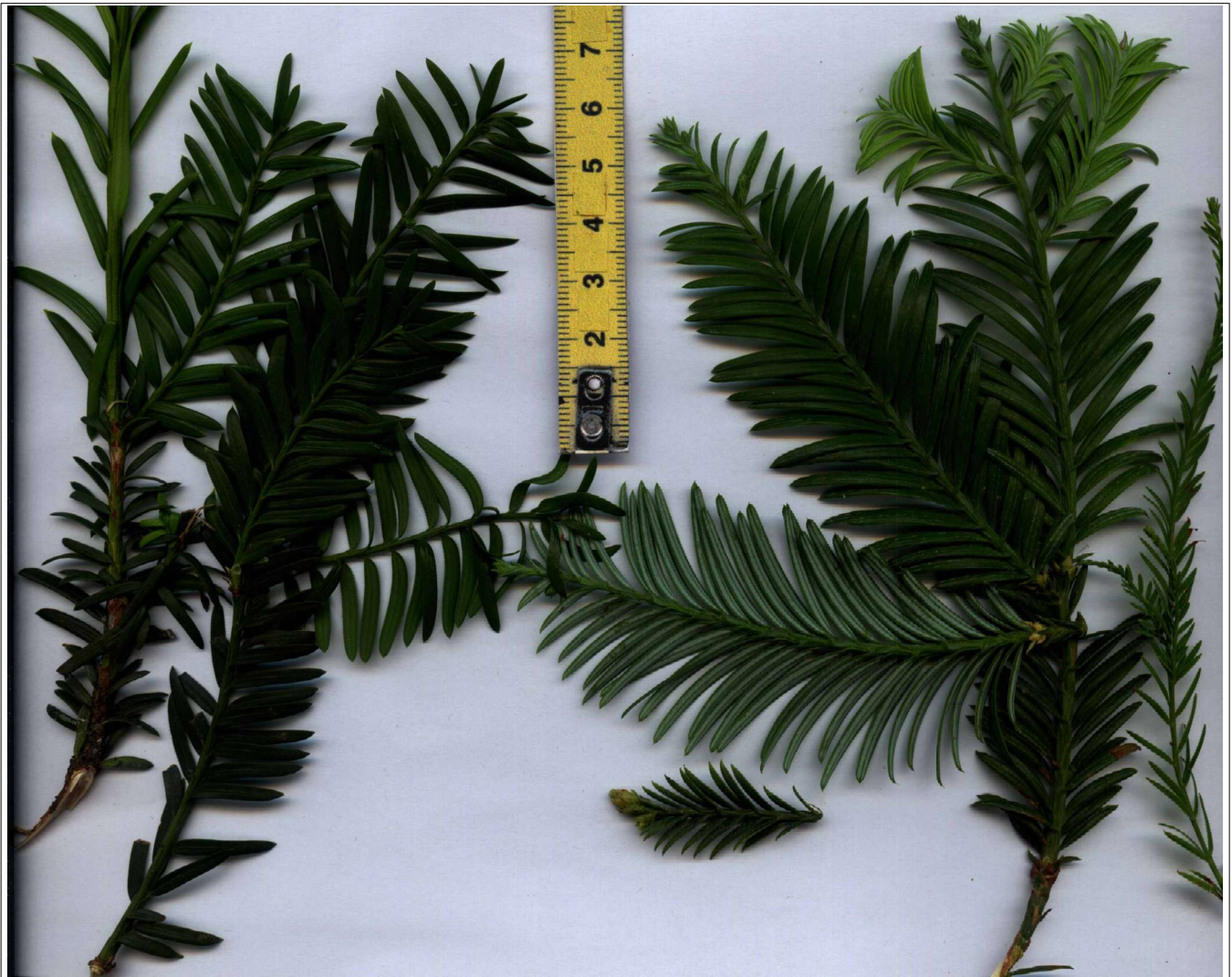
Taxus baccata ; échelle ; Sequoia sempervirens (= Sequoia taxifolia K.Koch) ; Taxodium portion de rameau dressé; rameaux plagiotropes rameaux plagiotropes (dont 1 petit, en bas, avec jeune cône) faces sup des feuilles essentiellement ; sauf 1 rameau retourné pour Taxus et Sequoia , les 2 apex arrivant juste sous l'échelle (face inf des feuilles). (juillet 2020)

2 Abies à branches à limbes très pectinés :